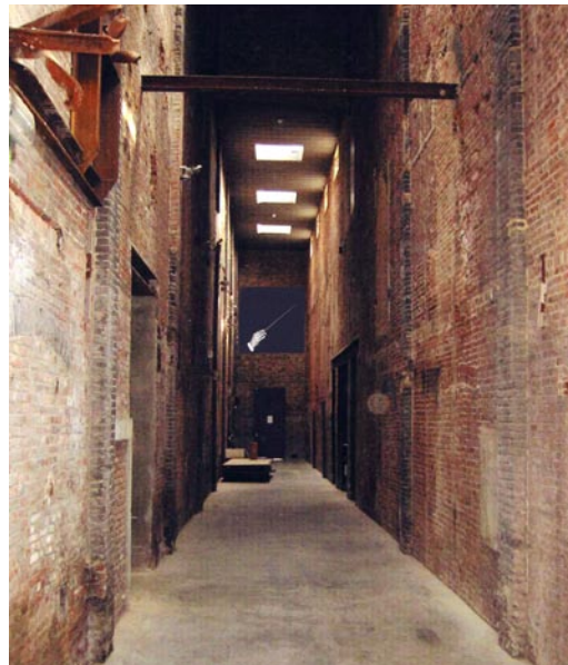
Vue de l'installation visuelle et sonore, Concert Pour Kanaal