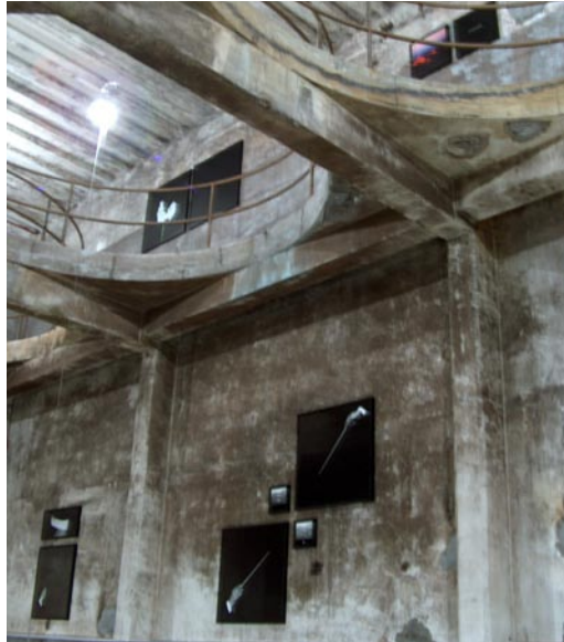
Vue partielle de l'exposition

Telle est la proposition de Nathalie Parienté Hors les Murs.